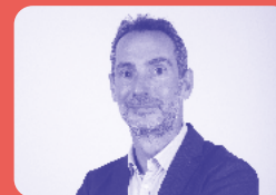
Yann PROBST MEDEF